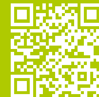
Fürstenfeld-App für Android