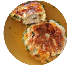
Rindsuppe mit Kaspressknödel