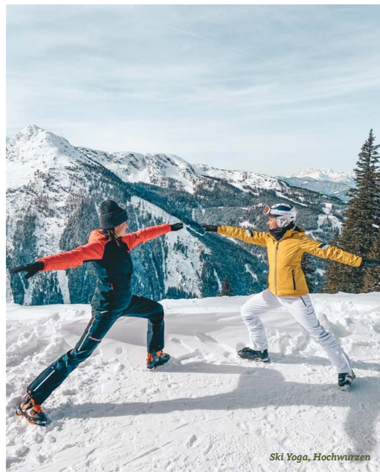
Ski Yoga, Hochwurzten

Du siehst also: das Einzige, was wir Dir bei aller Vielfalt in Schladming-Dachstein nicht anbieten können, ist Langeweile.