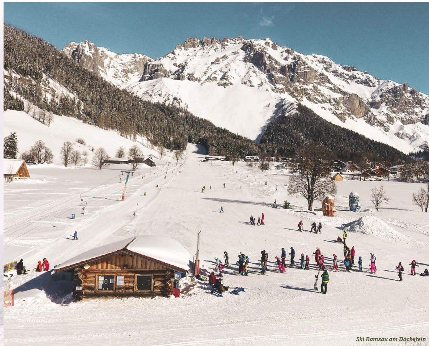
Ski Ramsau am Dachstein