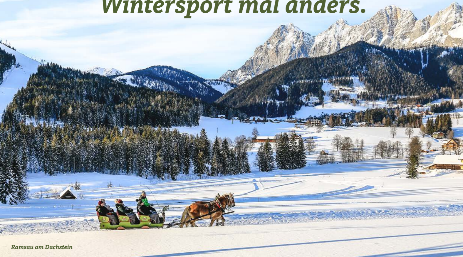
Ramsau am Dachstein