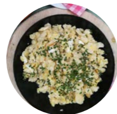
Nockn mit Ennstaler Steirerkas und Krautsalat