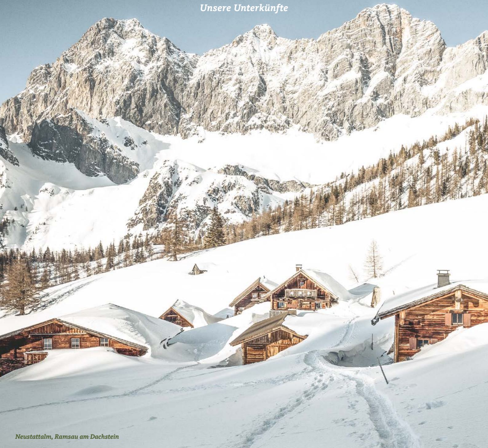
Neustattalm, Ramsau am Dachstein